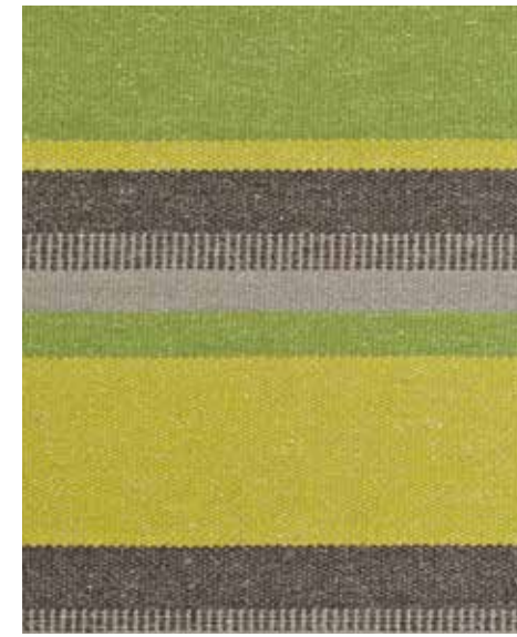
Traveller Roamer OWT02