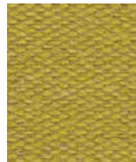
Aztec Tollan OWA03