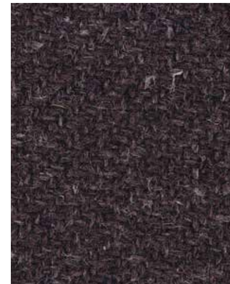
Nomad Hunter OWN04