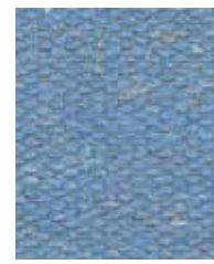
Aztec Native OWA01