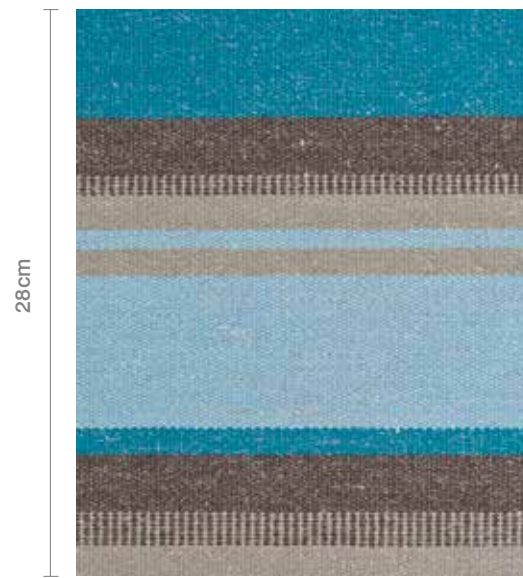
Traveller Drift OWT01