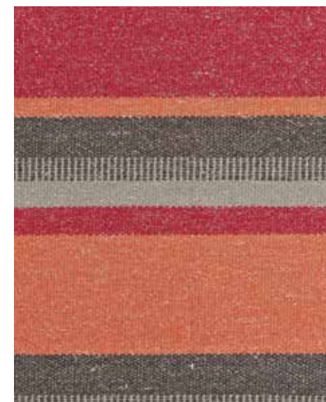
Traveller Wander OWT03