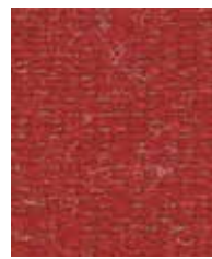
Aztec Sunset OWA07