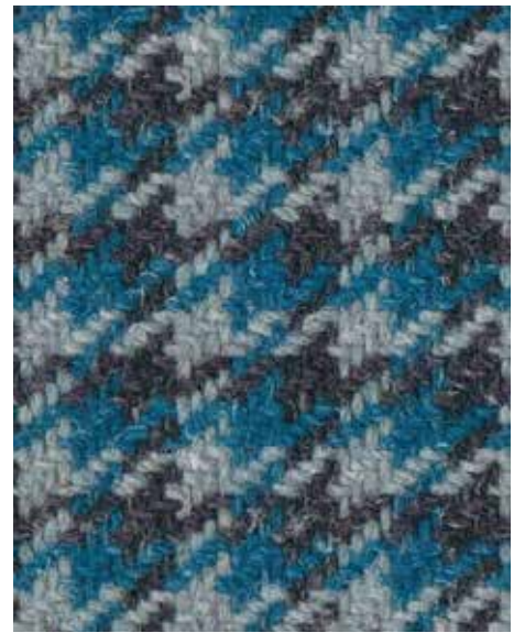
Nomad Journey OWN01