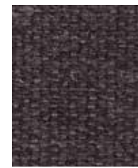
Aztec Eagle OWA08