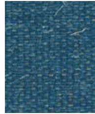
Aztec Inca OWA04