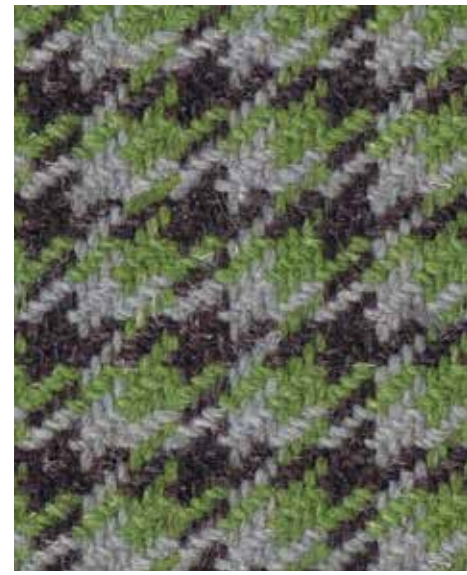
Nomad Migrate OWN02