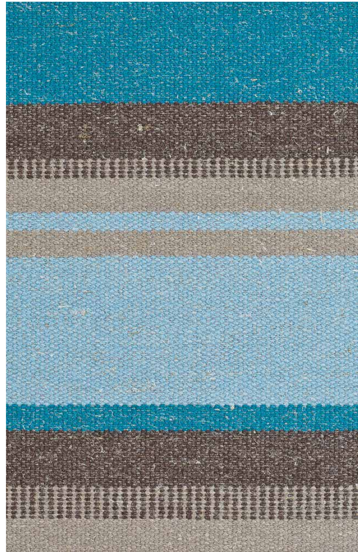
Traveller Drift OWT01