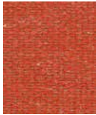
Aztec Horizon OWA05