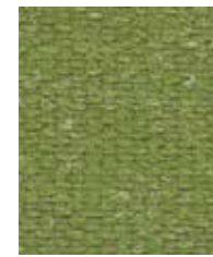
Aztec Maya OWA06